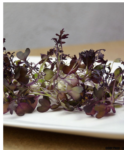
MOUTARDE ROUGE FRISÉE