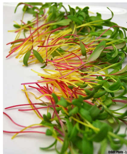
COTE DE BETTE