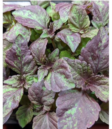
PÉRILLA SHISO RED